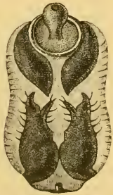
Fig. 1. Appareil génital \sigma .

\sigma . Pectore et ventre nigris, incisuris anguste pallidis ; segmento genitali magno, a latere viso apice truncato, supra late rotundato-exciso, subtus leviter sinuato et tuberculis duobus minutissimis mediis deorsum spectantibus instructo, apertura postica oblonga ; stylis genitalibus crassiusculis, apicem versus subito attenuatis et bifurcatis ; tuba anali appendicibus brevibus approximatis dependentibus instructa. Long. corp. 2\frac{1}{2} , cum homelytris 4 mill.